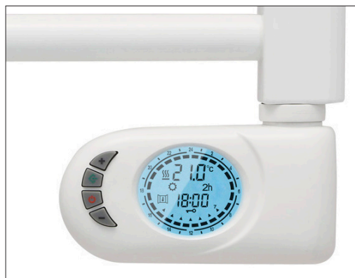
T700PE | T400PE | Detalle control TPE