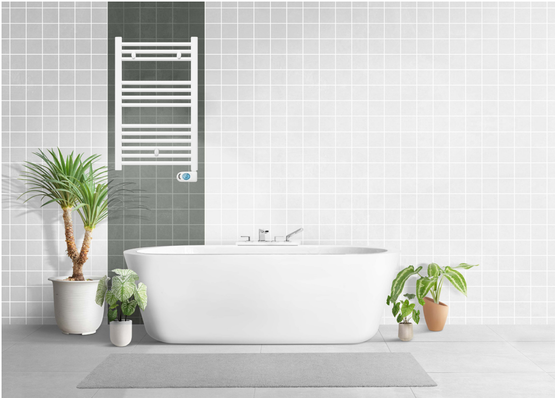
Modelo expuesto T400PE (879 x 500 mm) | Blanco recto

TOALLERO ELÉCTRICO FLUIDO CON CONTROL PROGRAMABLE